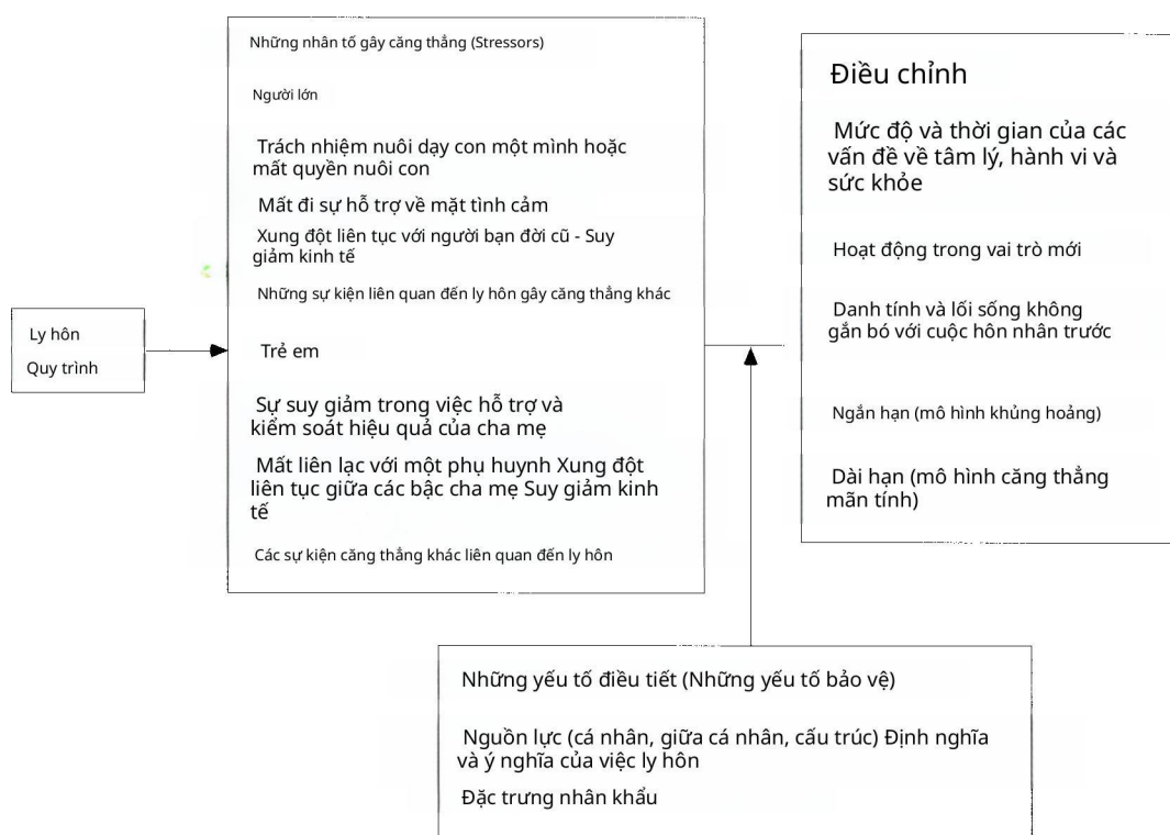
Hình 1. Quan điểm về ly hôn-căng thẳng-điều chỉnh

Bởi vì các khuôn khổ (khung tham chiếu) căng thẳng (stress frameworks) thống trị các tài liệu về ly hôn nên tôi đặc biệt chú ý đến chúng ở đây. Và bởi vì những khung lý thuyết này có nhiều điểm chung, tôi kết hợp các yếu tố của chúng thành một quan điểm tổng quát về ly hôn-căng thẳng-điều chỉnh. Mô hình khái niệm (conceptual model) này tích hợp các giả định được tìm thấy trong nhiều nghiên cứu riêng lẻ, giúp tổng kết và sắp xếp các phát hiện nghiên cứu cụ thể từ những năm 1990 và cung cấp một hướng dẫn cho các nghiên cứu về ly hôn trong tương lai. Quan điểm này cũng rất hữu ích bởi vì nó có thể áp dụng cho cả trẻ em lẫn người lớn.